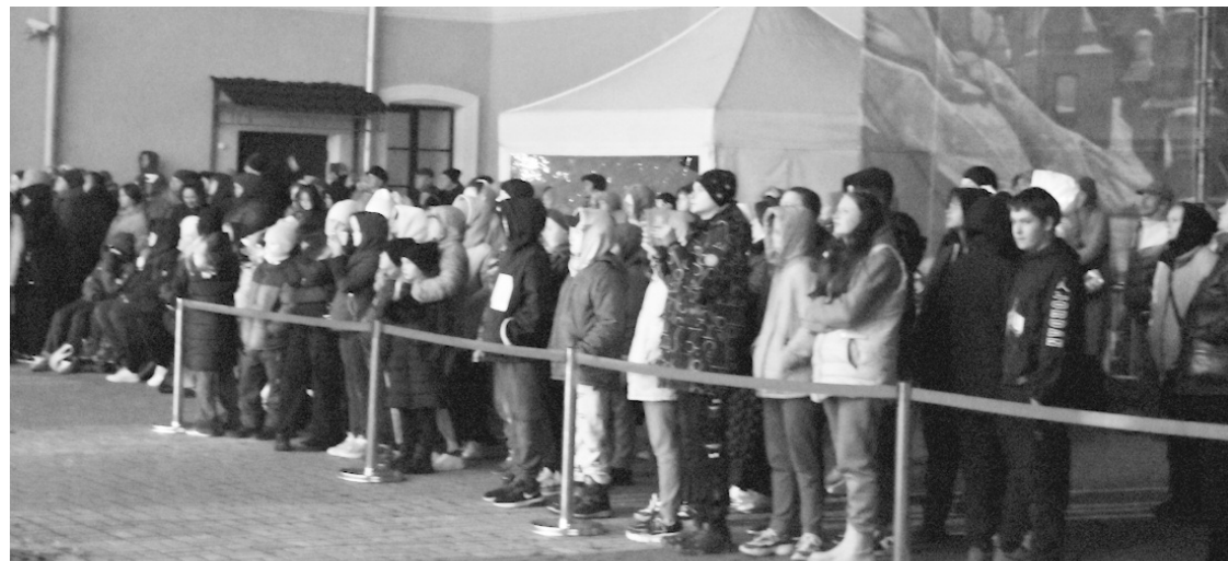
● Зрители во внутреннем дворе школы искусств им. Н. К. Рериха