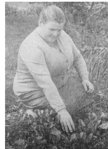
Фото С. Кучерова «СН» от 15 октября 1987 г.