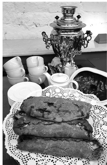
Знаменитый рыбник из Шлиссельбурга

ТУРИСТОВ ЗНАКОМЯТ С ГАСТРОНОМИЧЕСКИМИ БРЕНДАМИ ЛЕНИНГРАДСКОЙ ОБЛАСТИ