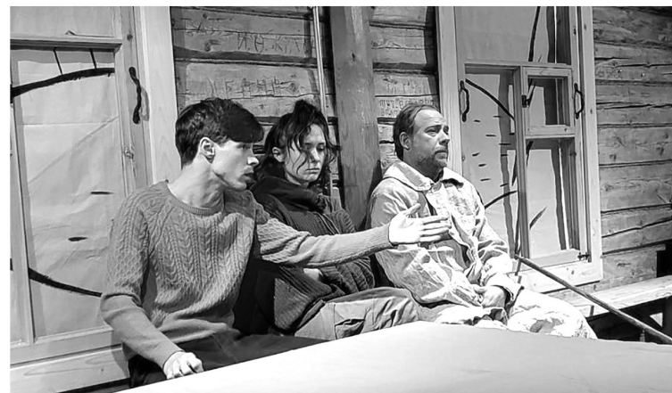
В Выре сцену артистам заменило пространство деревянного дома

АЛЕКСАНДРА СИДОРОВА